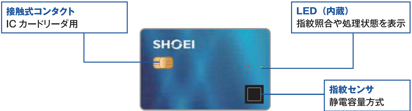
ー 構成イメージ ー

「IC カードによる所有認証」と「指紋による生体認証」の二要素認定を1枚のカードで実現する指紋認証 IC カード